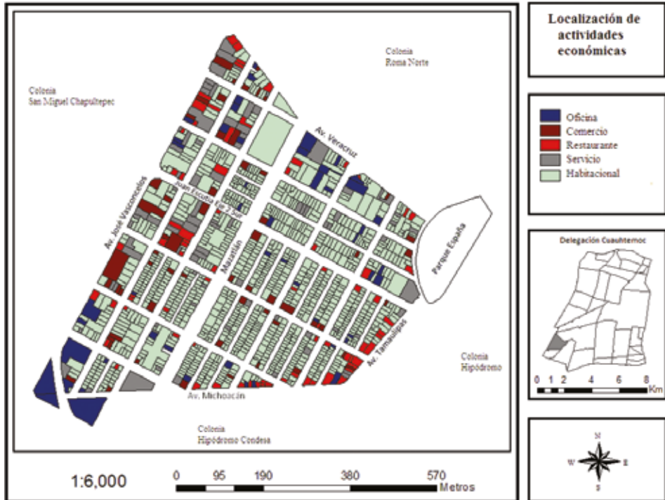
Figura 5. Localización de actividades económicas, 2012