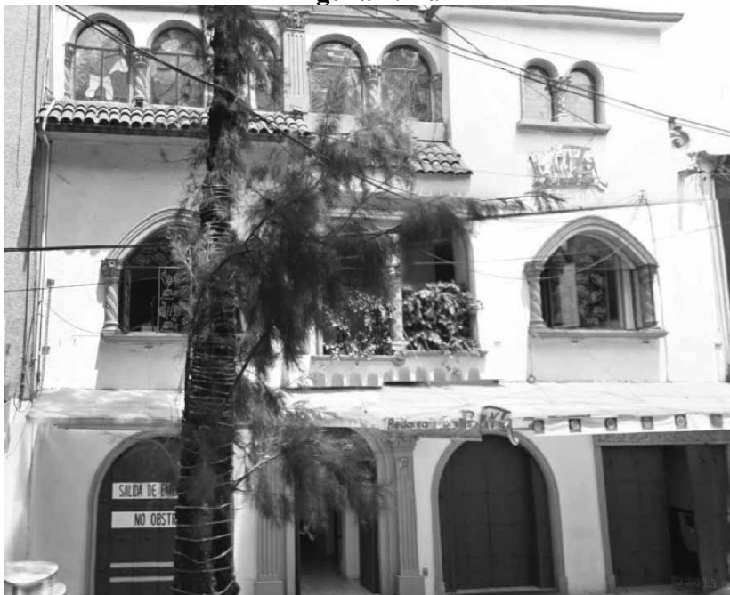
Figura 4. Bar