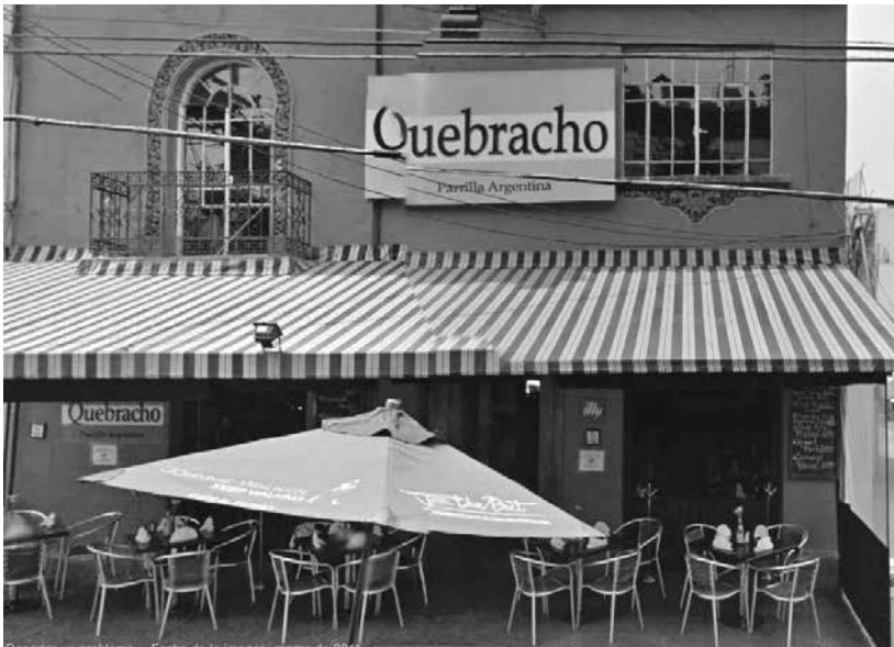
Figura 3. Restaurante de comida argentina