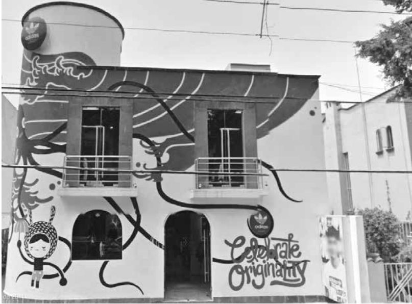
Figura 2. Tienda de ropa deportiva