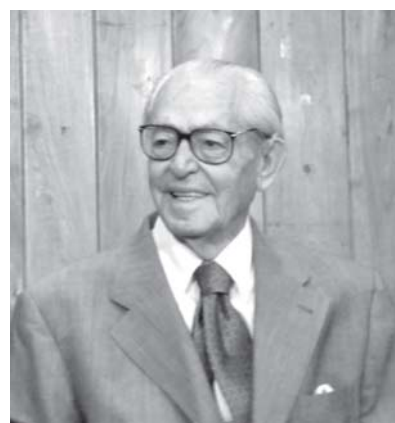
Adolfo Sánchez Vázquez