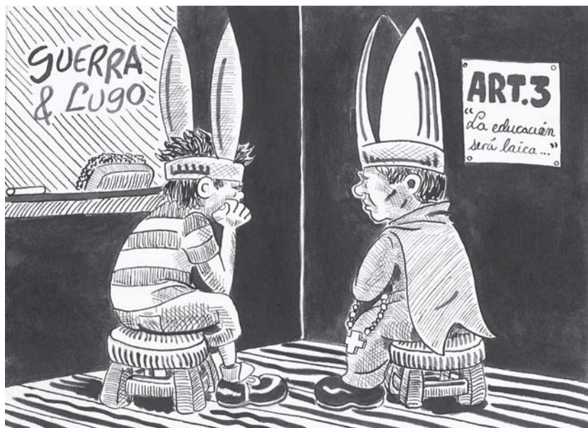
Guerra y Lugo / 2006.