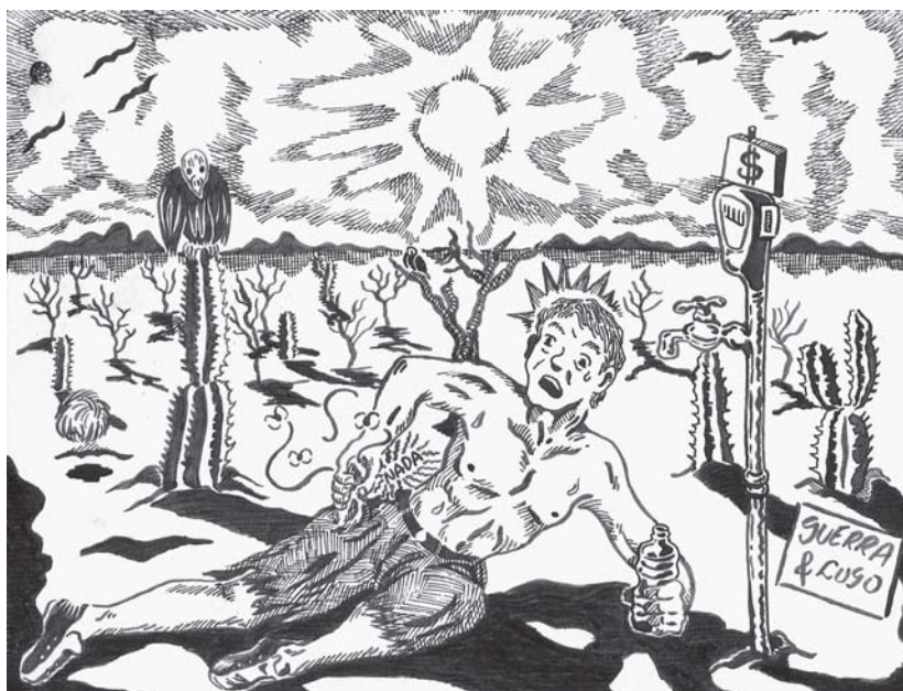
Guerra y Lugo / 2006.