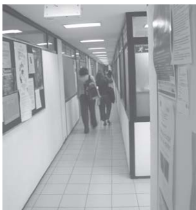
Pasillo de las Coordinaciones de la Facultad de Filosofía y Letras / Foto: Ernesto Scheinvar.

Al cumplir el primer año del segundo periodo como director de la Facultad de Filosofía y Letras, quiero informar a la comunidad sobre las acciones y logros más relevantes, así como de los proyectos a realizar durante el próximo año.