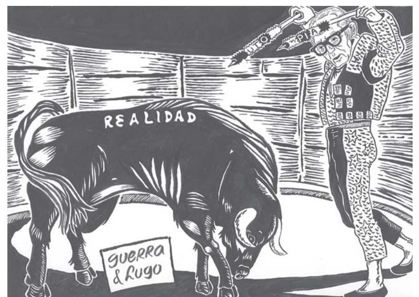
Guerra y Lugo / 2005