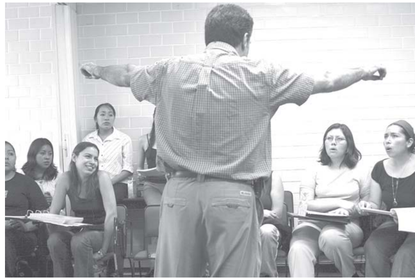
Coro de nuestra Facultad

Para nuestro director no es imposible moldear ninguna voz, pero no perdona una mala actitud.