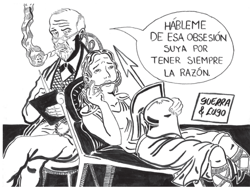
Guerra y Lugo / 2005