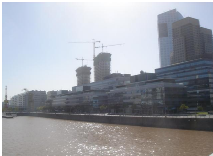
Fotografía 1. Zona comercial y residencial de Puerto Madero