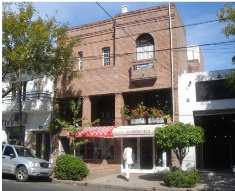
Foto 4. El comercio en Palermo Soho.

(Abril de 2010).