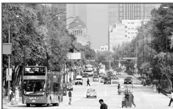
Foto 6. Avenida Juárez en la actualidad.