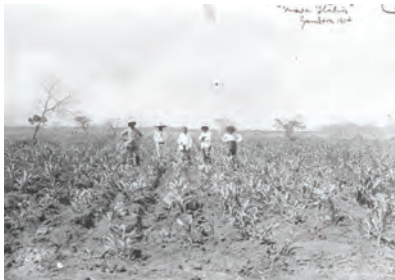
Gámbara en 1914.