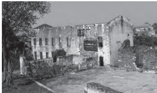
El molino de Nueva Italia en la actualidad.