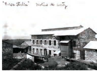
El molino de la hacienda Nueva Italia en funcionamiento.