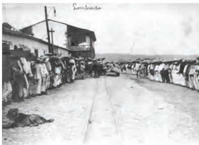
Día de raya en la hacienda Lombardía.