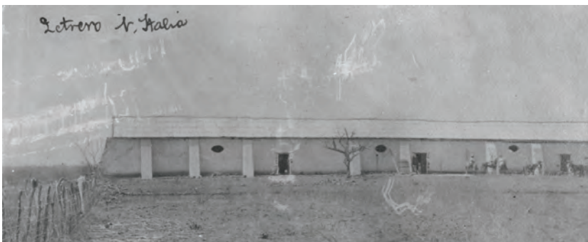
Edificio en El Letrero, hacienda Nueva Italia.