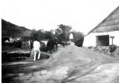
Asoleadero en la hacienda Lombardía.