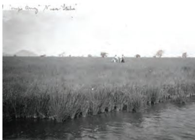
Campo de arroz en la hacienda Nueva Italia.