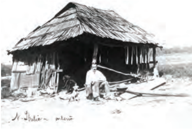
Ordeña en la hacienda Nueva Italia.