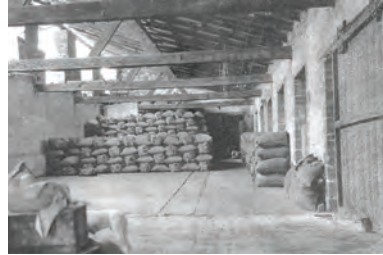
Una de las bodegas de la hacienda Nueva Italia donde se almacenaba el arroz ya preprocesado, listo para ser transportado a Uruapan.