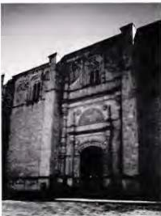
PORTADA PRINCIPAL Y FACEDA LATERAL DE LA IGLESIA EN YAMPIELAN, OAXACA