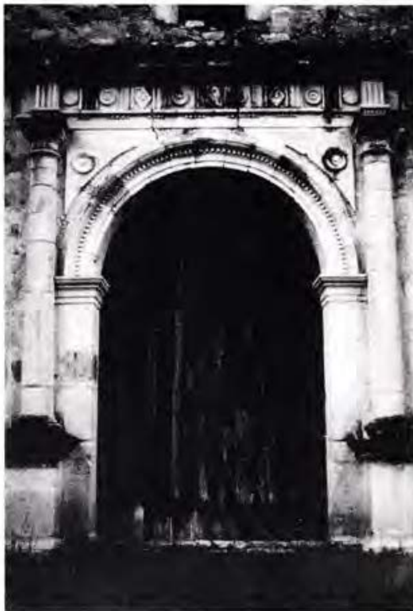
PORTADA LATERAL DEL TEMPLO DE SANTIAGO EN TELANCANTO, OAXACA.

El mundo rural de los conjuntos conventuales empezó a ver su fin por la séptima década del siglo xvi. Los frailes y conquistadores, pioneros del Nuevo Mundo que habían soñado, estaban muertos o demasiado viejos. La encomienda fracasaba, las continuas epidemias mermaban a la población indígena con la consecuente pérdida de importancia de los mendicantes, a quienes, por si fuera poco les secularizaban paulatinamente sus templos. El espíritu rural que había caracterizado a los cincuenta años que siguieron a la conquista, agonizaba junto con los ideales de la época dorada de Nueva España.