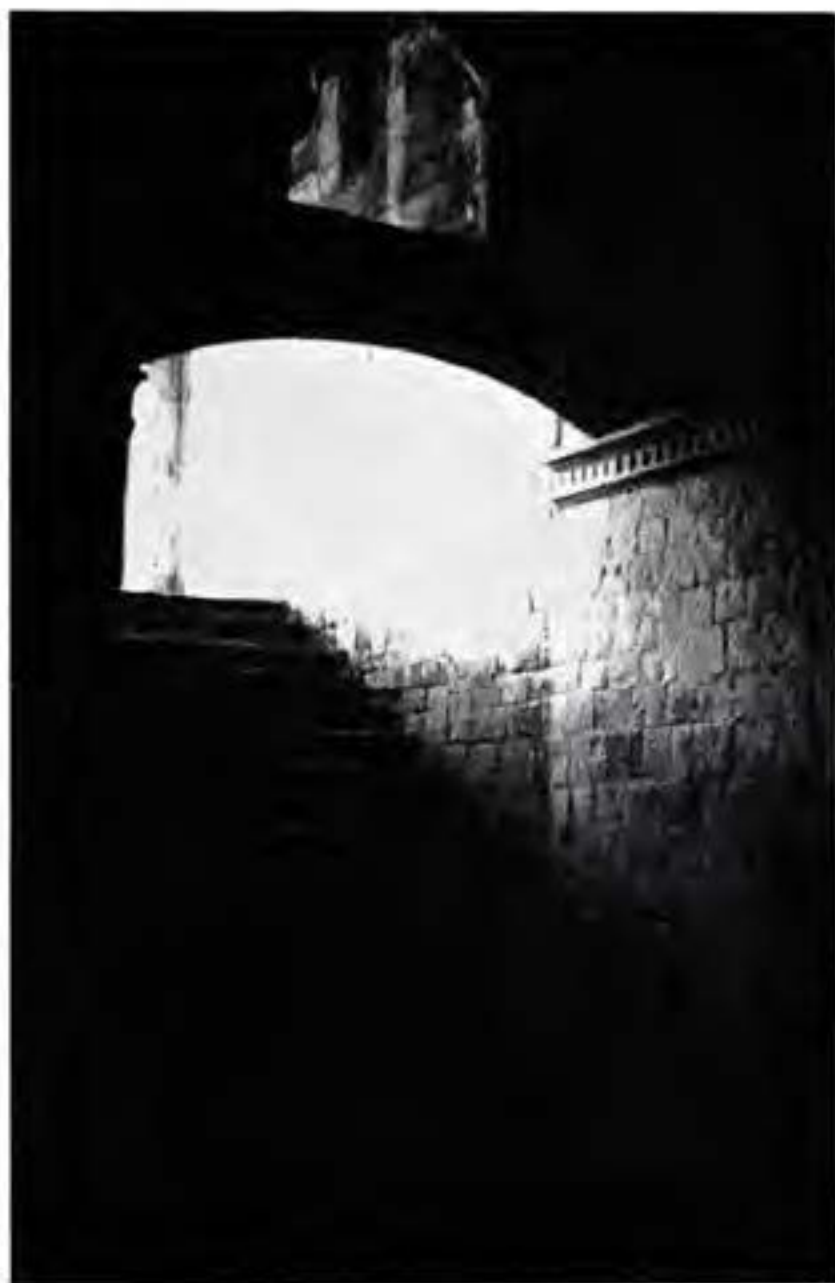
CUBO DE LA ESCALERA DEL CONVENTO DE YANHUITLÁN EN OAXACA.