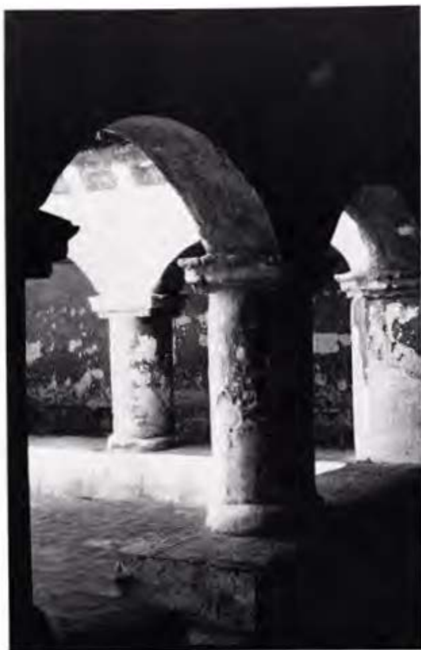
CAJONILLO DE SAN JERÓNIMO EN TLACÓCHIMILCO, D.F.

14 tir a los indios. A esta devoción vino a agregarse la del hábito, pues los indígenas cubrían con esa vestimenta a sus pequeños y los ofrecían al santo si los curaba de alguna enfermedad o los protegía de algún peligro. El hábito se ceñía a la altura del tallo con un cordón que fue también objeto de devoción y al cual se le atribuyeron propiedades guerreras, curativas y hasta meteorológicas. Los niños lo usaban como protección; los adultos como escudo contra el pecado; los enfermos para recuperar la salud; y las parturientas para dar a luz sin dolor y verse libres del peligro de muerte. El cordón de san Francisco evitaba también las primeras heladas del mes de octubre que caían alrededor del día cuatro y destruían los sembradíos.