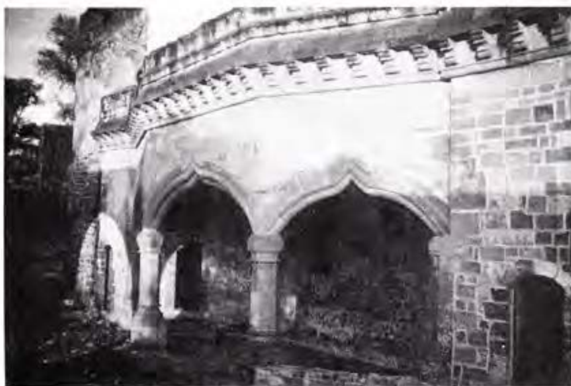
CAPILLA ABIERTA DEL SIGLO XV EN SAN FRANCISCO TUACANA.