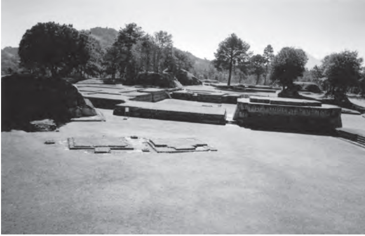
La ciudad kaqchikel de Iximché. (enero de 2006).

alumbran en la noche, que acompañan las ceremonias mayas y que recrean tantos poemas de Ak'abal. Dicen los Señores de la Muerte, Hun-Hunahpú y Vucub-Hunahpú, en el Popol Wuj : “Idos ahora a aquella casa [...]; allí se os llevará vuestra raja de ocote y vuestro cigarro y allí dormiréis” (2003: 55). La prueba que les ponen los de Xibalbá a los primeros padres es que, encendiendo los cigarros y el ocote que se les sean entregados, no los consuman y los entreguen intactos al amanecer. Los primeros gemelos son vencidos; los segundos, no.