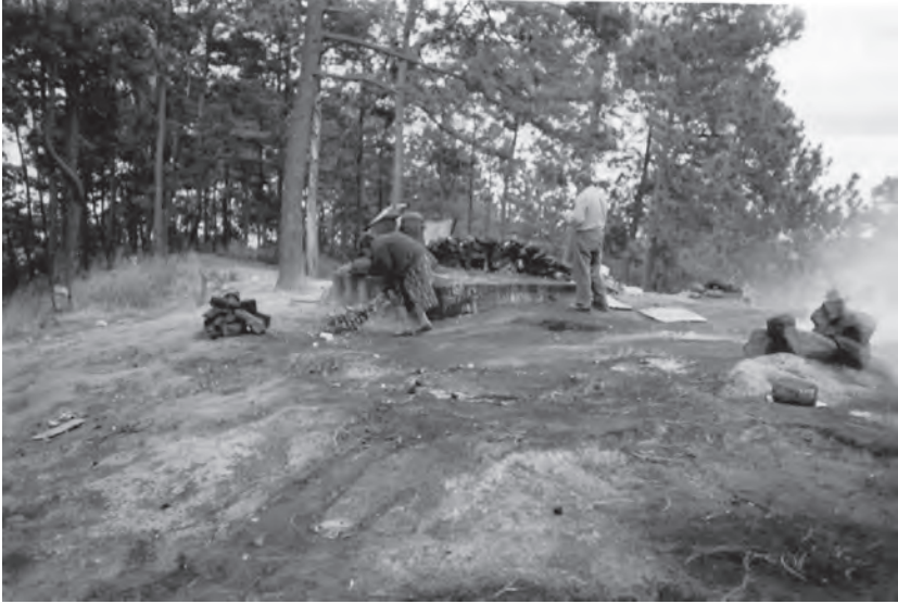
Ceremonia en Pascual Ab'aj . Foto: Ana María Ferreira y Juan Guillermo Sánchez (enero de 2006).

lugar de la creación para los momostecanos. Cada uno de estos lugares son espacios en los que todavía hoy se viven tradiciones milenarias en torno a los intercambios con el otro mundo a través de las sustancias sagradas.