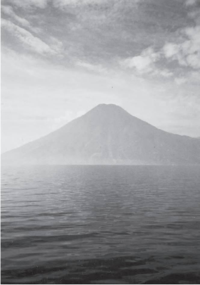
El Lago Atitlán a orillas de Panajachel. Al fondo, el volcán San Pedro. Foto: Ana María Ferreira y Juan Guillermo Sánchez (enero de 2006)

nuestros padres. Pero estando éstos bien instruidos, usaron de sus encantos formando nubes, truenos, relámpagos, granizos, temblores y demás que acompañaron a los espantajos” (2004: 175). Así lo vive Ak’abal en sus versos: cada una de esas manifestaciones de la naturaleza no son desgracia, son vida, son memoria de los dioses antiguos ( Ojer ). Así lo hace saber en “Tempestad / Kaqlja ”: