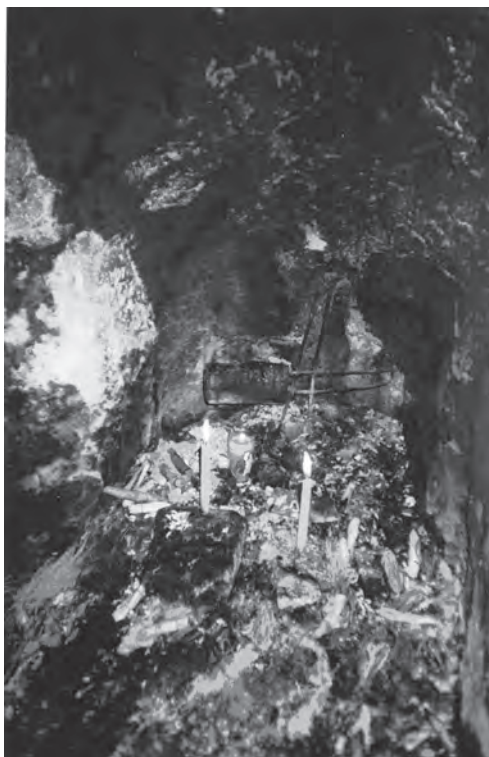
Altar Maya al interior de la cueva de Utatlán, justo debajo de la pirámide de Tohil, en la antigua ciudad de Gumarcaah . (enero de 2006).

Para el imaginario k’iche’ —según Schele— las cuevas son las moradas de “los mundos”, de los señores de la tierra, de los que permiten matar animales y perturbar la tierra sembrando el maíz. Para lograr el agrado de “los mundos”, es fundamental el kexol o “sustituto”, quien servirá de intercambio. El kexol puede ser el sacrificio de una gallina o los itz , las ofrendas que sustentan a los dioses. Y sólo dentro de esta gnosis 5 o sistema de conocimiento es