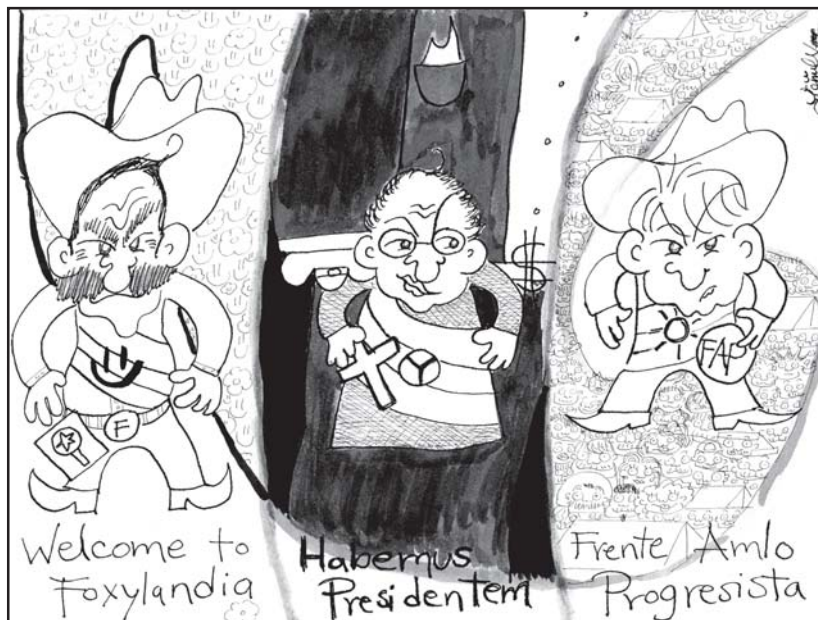
Cordova / 2006.