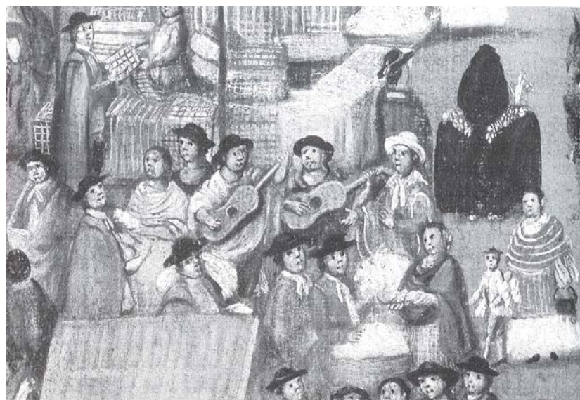
Hombres tocando la guitarra, detalle del cuadro anónimo Visita de un virrey a la Catedral de México , 1720, tomado de Historia de la vida cotidiana en México , II. La ciudad barroca , coordinado por Antonio Rubial. México, El Colegio de México/FCE, 2005.

Un poco el tiempo, pues por la labor docente no se dispone del tiempo necesario que uno quisiera tener para ir a fondos reservados, archivos y demás repositorios que se encuentran en nuestra ciudad y en otras de riquísimos acervos como Puebla o Querétaro. ♦