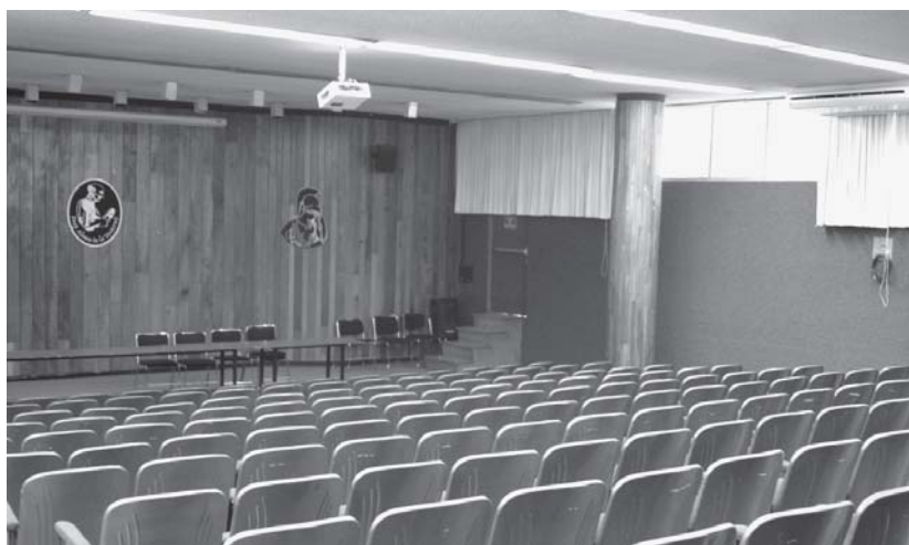
Aula Magna Fray Alonso de la Veracruz

• Mesa redonda: Hacia una economía política de la ecología / 31 de agosto , 17:00 a 19:00 horas, Salas A y B.