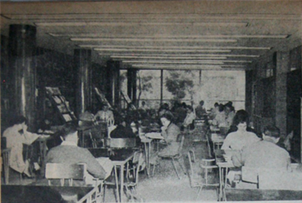
Biblioteca de la Facultad.