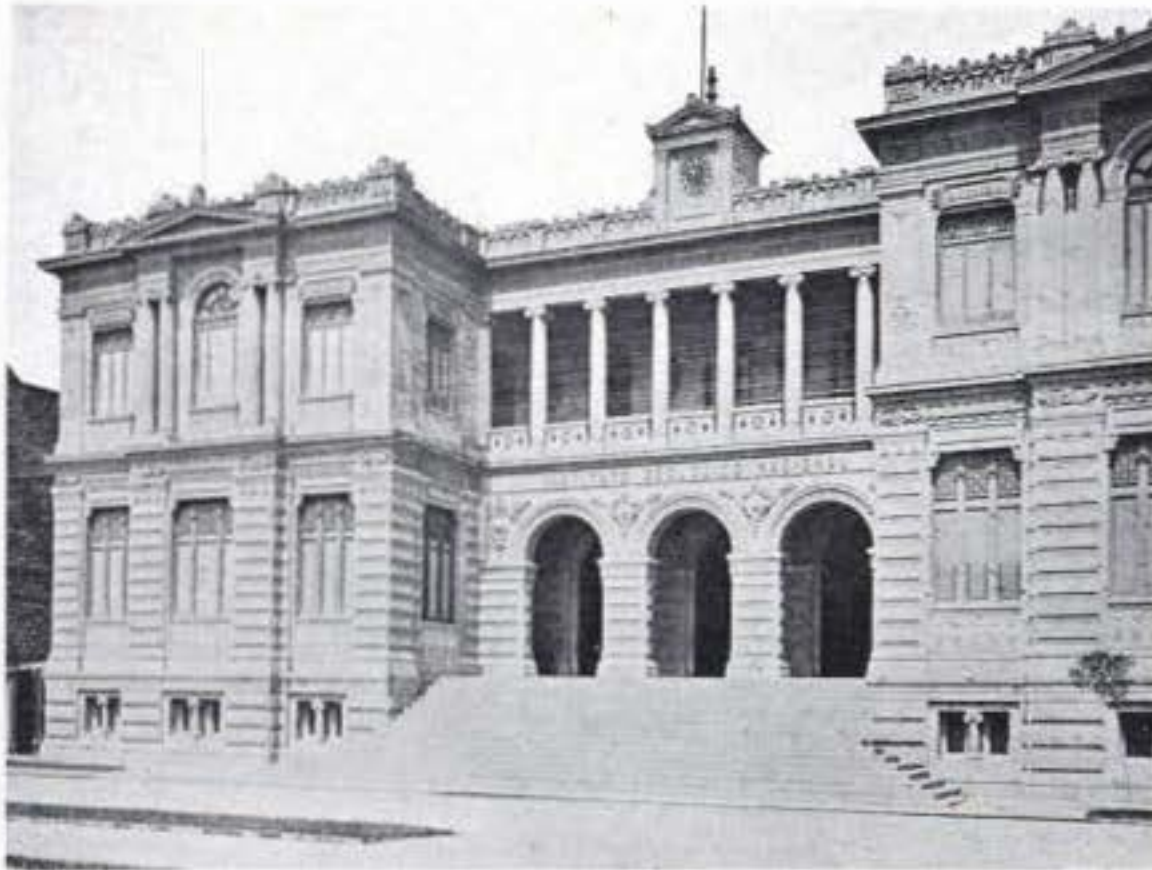
INSTITUTO GEOLOGICO NACIONAL