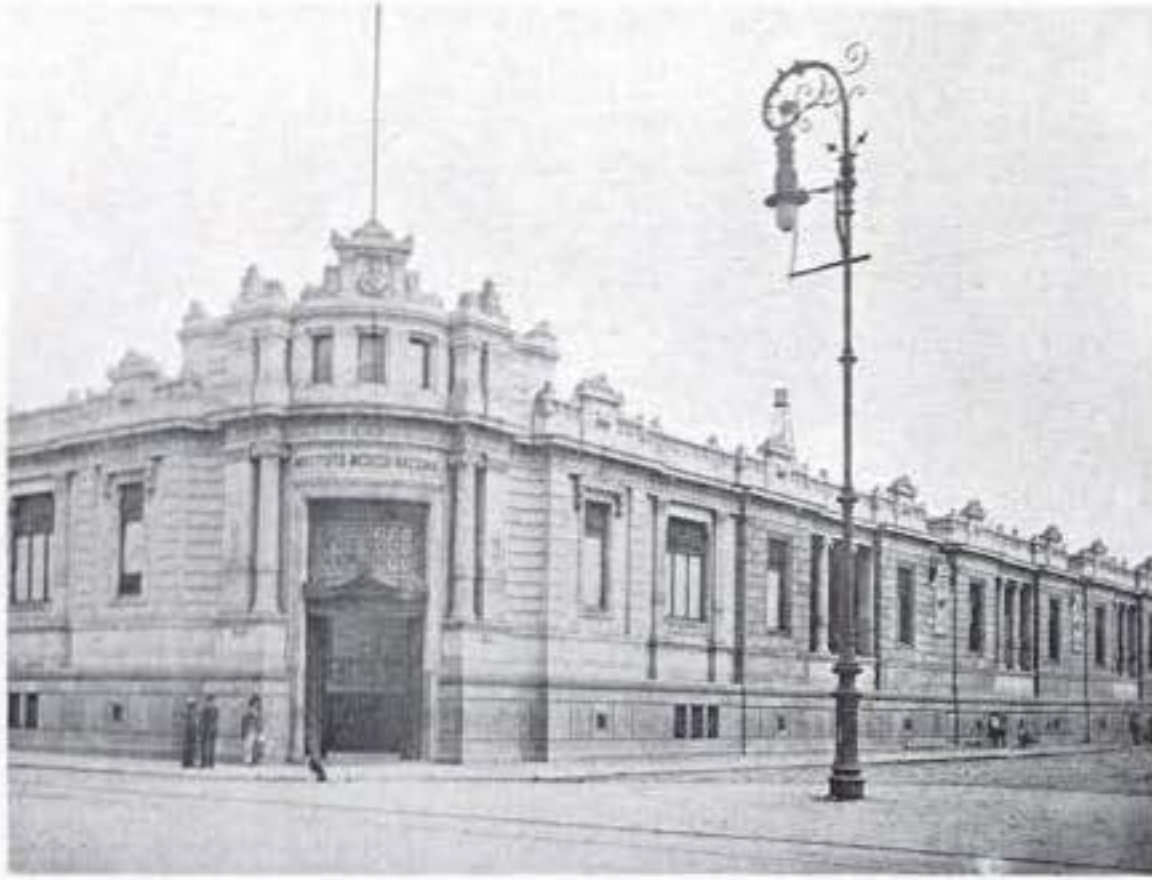
INSTITUTO MEDICO NACIONAL